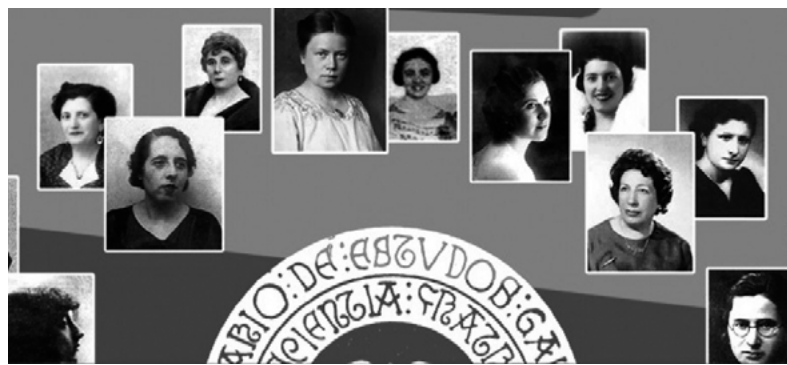
Cabeceira da exposición As mulleres do Seminario de Estudos Galegos