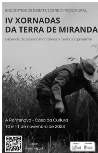
Cartel das xornadas Terra de Miranda