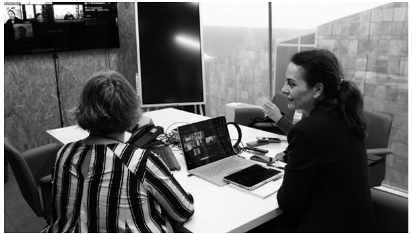
Programa Escolas de fronteira