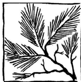
Cartel Premio Arume