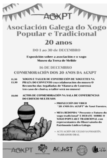
Celebración dos 20 anos da AGXPT

Facémonos eco tamén aquí da celebración do XX aniversario do Grupo Cavila, de Nova Escola Galega, que presta a súa atención ás necesidades socioeducativas ao redor dos materiais e recursos curriculares e didácticos. Unha cuestión viva e decisiva dentro da educación actual, pois evolucionan á par dunha sociedade influída polo rápido avance das tecnoloxías. Paralelamente, as necesidades educativas varían tanto condicionadas polas demandas e intereses do propio alumnado e dos do profesorado, co que interactúan, como polas necesidades que presenta cada realidade contextual e polas das derivadas da propia evolución social, como o amplo abano de posibilidades que a dixitalización achega.