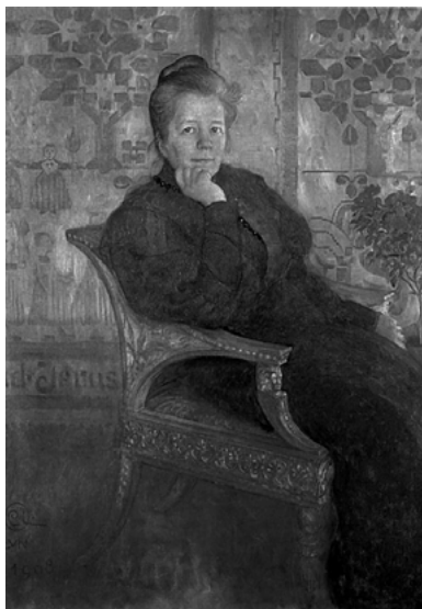
Óleo de Carl Larsson, 1908