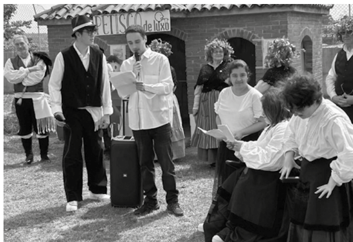
Romaría popular celebrada no colexio ao remate do proxecto.

tividades baixo o paraugas do Deseño universal de aprendizaxe como o marco que rexe a nosa metodoloxía, e xeramos recursos motivadores que inclúan o total dos implicados con esa mirada na que todas e todos son esenciais, cunha metodoloxía activa e colaborativa na que ten un valor esencial a creación de redes e onde todos e todas crecemos da man.