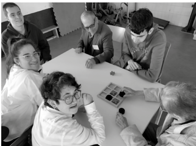
Un grupiño xogando ao pai-fillo-nai.