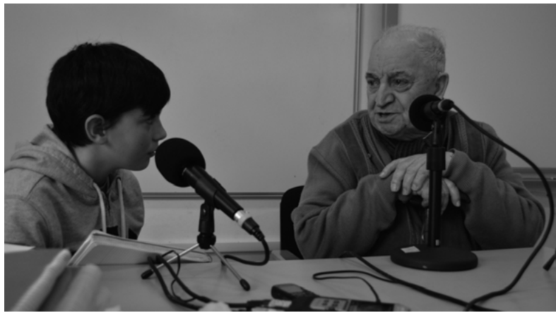
Dous participantes da experiencia interxeracional, no CEIP Barouta, gravando unha entrevista.

As sesións e actividades estiveron fundamentadas no pro-