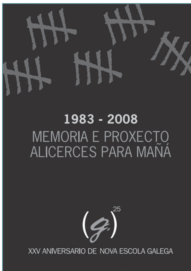
Publicación da Memoria dos XXV anos de NEG (2008).