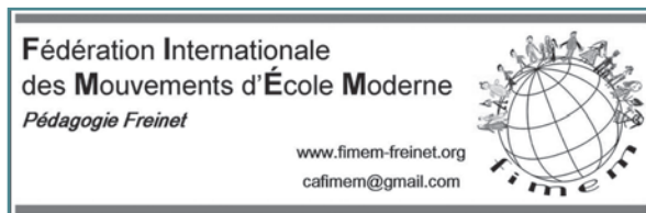
Algunhas relacións internacionais de NEG.

tatal, destacando a participación representativa nalgúns momentos no órgano directivo da Confederación, a presenza de varios asociados/as en máis de 25 Encontros Estatais de carácter anual e a presenza de Delegacións nos II e III Congreso dos MRP celebrados respectivamente en Gandía (1989) e Torremolinos (1996). Cabe destacar que Nova Escola Galega levou a cabo a organización do XXII Encontro Estatal de MRP no ano 2006, coa participación de cen ensinantes de todo o Estado, e tamén o XXXIII, celebrados ambos en Santiago de Compostela.