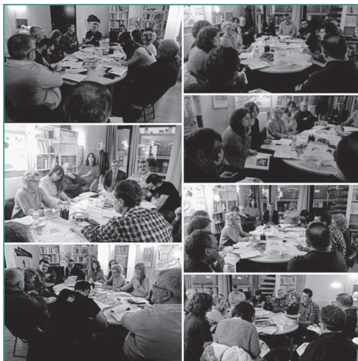
Consello de Redacción da Revista Galega de Educación.