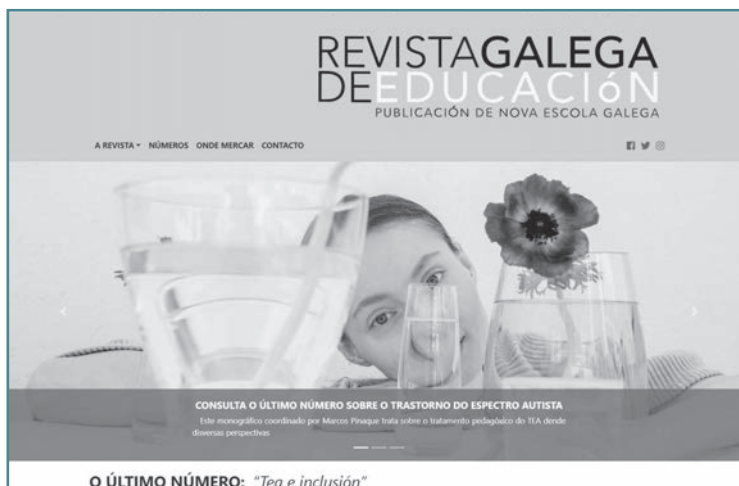
Páxina web da Revista Galega de Educación (rge.gal).