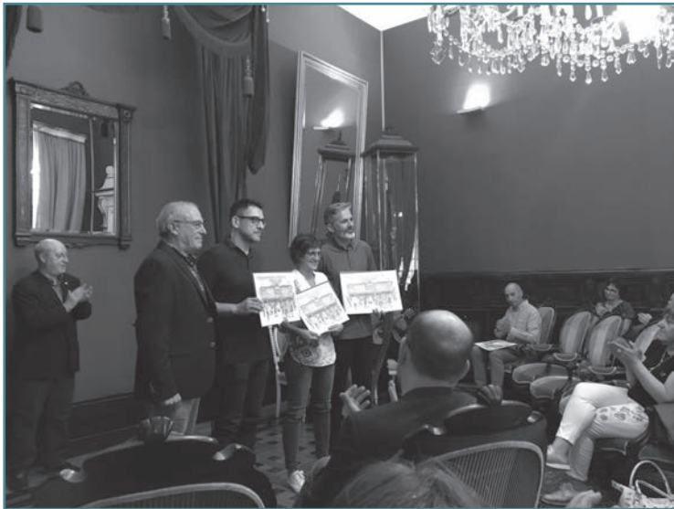
Entrega de Premios EducaCompostela 2019.

respuestas que ofrece o material para promover o uso e difusión da lingua galega a través dos videoxogos, a robótica e os medios audiovisuais. •