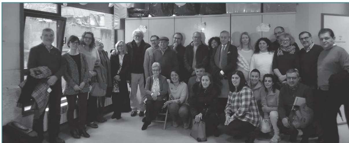
Recoñecementos Suso Jares (2020).

e dinamización da biblioteca escolar concibida como centro de recursos e espazo de contacto coa información dentro das escolas. A Asesoría de Bibliotecas Escolares promove nestes centros programas de fomento da lectura como «Hora de ler», «Ler en mancomún», «Libros a oito», «Maltas viaxeiras», «Clubs de Lectura», «Radio na Biblio», «Clubs de Lectura», «Biblioteca Creativa (antes «Proxecto Escornabots na biblioteca escolar»)»; programas de innovación como o «Concurso de Traballos por Proxectos coordinados ou co apoio da biblioteca escolar», «Voluntariado da lectura», «Programa de Bibliotecas escolares solidarias», «Bibliotecas escolares inclusivas» e actividades de formación do profesorado como as «Xornadas de Bibliotecas Escolares de Galicia», os «Encontros do Plan de mellora de bibliotecas escolares» e os «Encontros dos Clubes de lectura», nos que participan cada edición varios milleiros de profesores e profesoras. A Asesoría de Bibliotecas Escolares desenvolve desde hai máis de quince anos un programa cada curso máis diverso de innovación didáctica, tinguido cos valores do ensino cooperativo e da educación para a paz, que os promotores dos «Recoñecementos Suso Jares» consideramos deben ser visibilizados por toda a comunidade educativa.