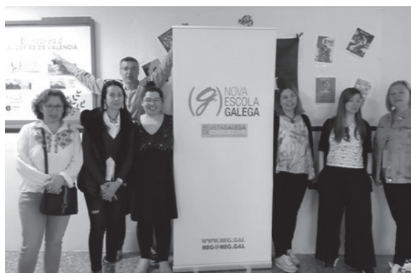
CAVILA en Valencia durante a celebración do XV Seminario Internacional de Avaliación de Materiais Jaime Martínez Bonafé (2023).

para aprender: STEAM , os dous volumes sobre videoxogo na Revista Colombiana de Educación (nº 84 e nº 85, ano 2022) ou o nº 39 de Pedagogía Social. Revista Interuniversitaria (2021), baixo o título Recursos educativos y materiales didácticos en contextos sociocomunitarios .