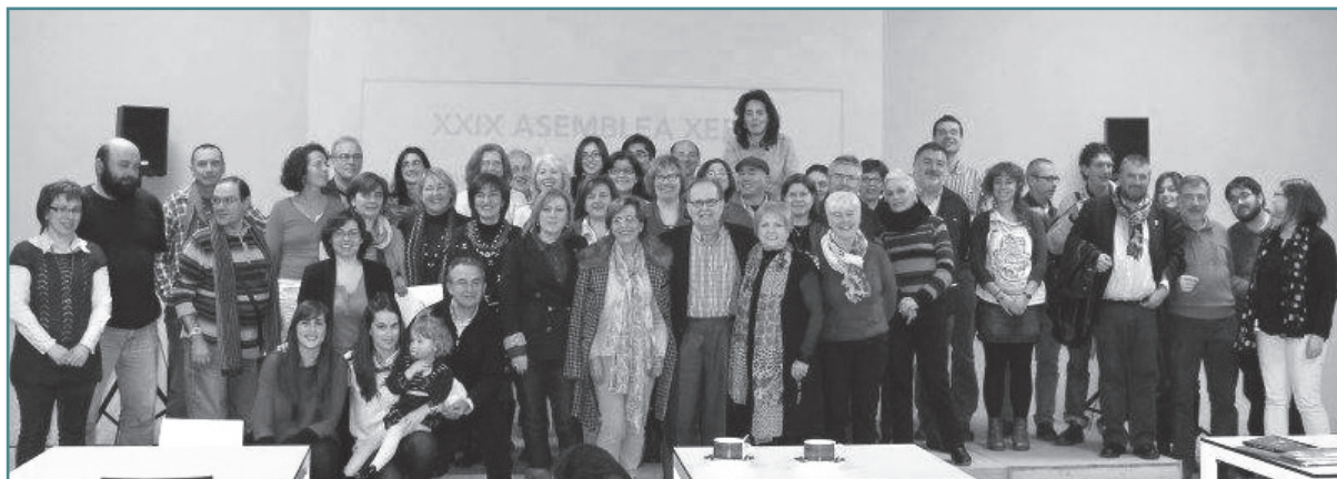
XXIX Asemblea de NEG. A nave de Vidán, 2013.