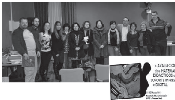
Fotografía de grupo do Seminario do ano 2011.

Este Seminario de Avaliación de Materiais Didácticos comeza a desenvolverse no ano 2010 (Imaxe 2) e con esta actividade compartimos e reflexionamos desde unha perspectiva profesional sobre o papel dos recursos educativos nos procesos educativos. Ao tempo, xéranse estratexias para implicar ao membros da comunidade educativa na súa análise e valoración. Desta forma, configúrase como unha aprendizaxe recíproca para o enriquecemento mutuo. O seu formato é a través dun seminario-obradoiro no cal avaliar materiais didácticos de diferente índole e tipoloxía