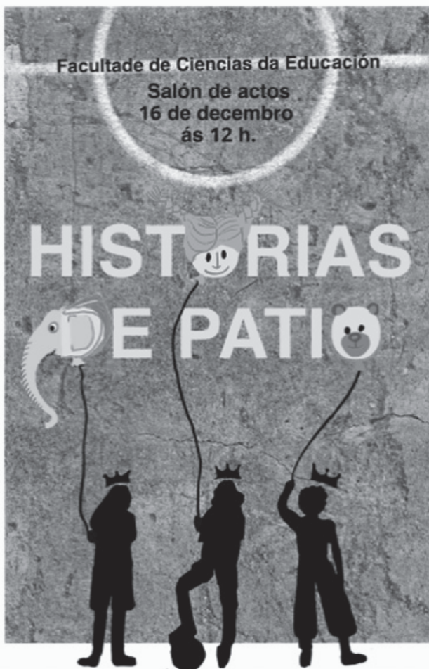
Cartel da obra de teatro infantil do curso 2022/2023 (USC).