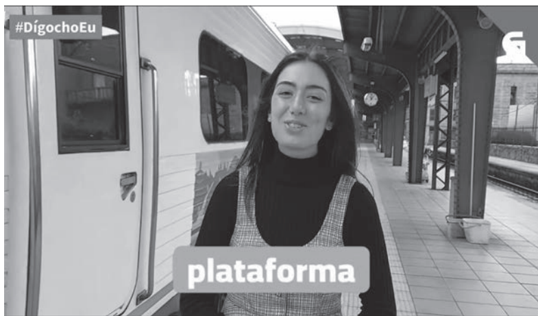
Programa "Digocho eu".