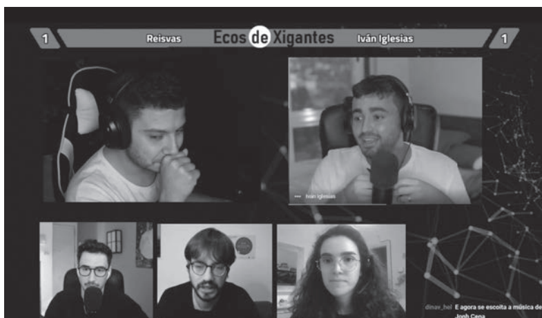
Proxecto de divulgación científica "Ecos de xigantes".

Non existen suficientes motivos polos que o galego como lingua nai, lingua ambiental ou segunda lingua precise de recursos audiovisuais para a potenciación da súa consideración ou a ampliación dos seus usos?