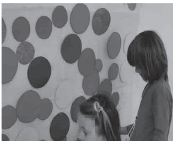
Ilustración 6. Experimentación coa obra de Yayoi Kusama.