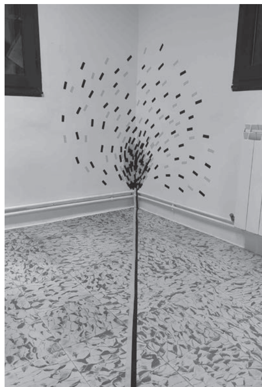
Ilustración 1. Espazo inspirado na obra de Marcos Chaves (espiral con cinta).

Para a preparación do ambiente visitouse o centro en cinco ocasións para coñecer ben o espazo dispoñible, valorar diferentes materiais e as súas posibilidades no espazo para, finalmente, preparalo o día da sesión co resultado que se pode observar nas ilustracións 1, 2, 3 e 4.