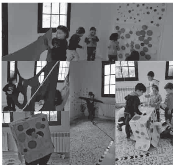
Ilustración 5. Accións de experimentación libre no ambiente de aprendizaxe.

Tras a experiencia vivida e a escoita e observación por parte do profesorado, débese tamén reflexionar, para futuras intervencións, sobre a implicación que pode ter para o alumnado ser o creador dos seus propios ambientes de aprendizaxe. ■