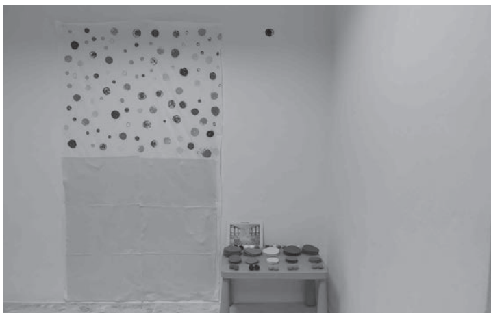
Ilustración 4. Espazo inspirado na obra de Yayoi Kusama (círculos de cores).