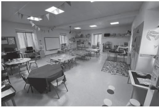
Aula da Escola Rural de Sedes.

pasou a ser mixta e a actuar como unha unitaria baixo a dirección académica da concentración escolar Colexio Público O Feal. Paralelamente, nese mesmo ano de 1972 as outras tres escolas rurais de Sedes son pechadas precisamente en beneficio do actualmente denominado CPI do Feal (localizado á beira do polígono industrial urbano de Narón, coñecido como As Lagoas), co que quedaba "inaugurado" o continuado proceso institucional de "enfraquecemento" de servizos públicos básicos neste territorio rural.