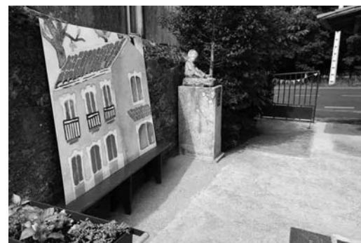
Patio dianteiro da Escola Rural de Sedes.

Como remate deste apartado queremos poñer de manifesto, por un lado, o labor dos mestres e mestras que exerceron a docencia na escola de Sedes, e por outro, que existen outros factores socioeducativos relacionados coa existencia desta escola senlleira, rural e centenaria condicionados a unha análise máis incisiva, nivel que esta sucinta reportaxe non pode acadar.