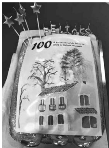
Torta conmemorativa do centenario da Escola Rural de Sedes.