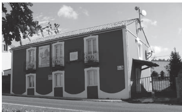
Fachada principal da Escola Rural de Sedes.