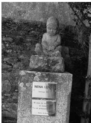
Escultura en pedra "Nena lendo_" conmemorativa do 90 aniversario da Escola Rural de Sedes.