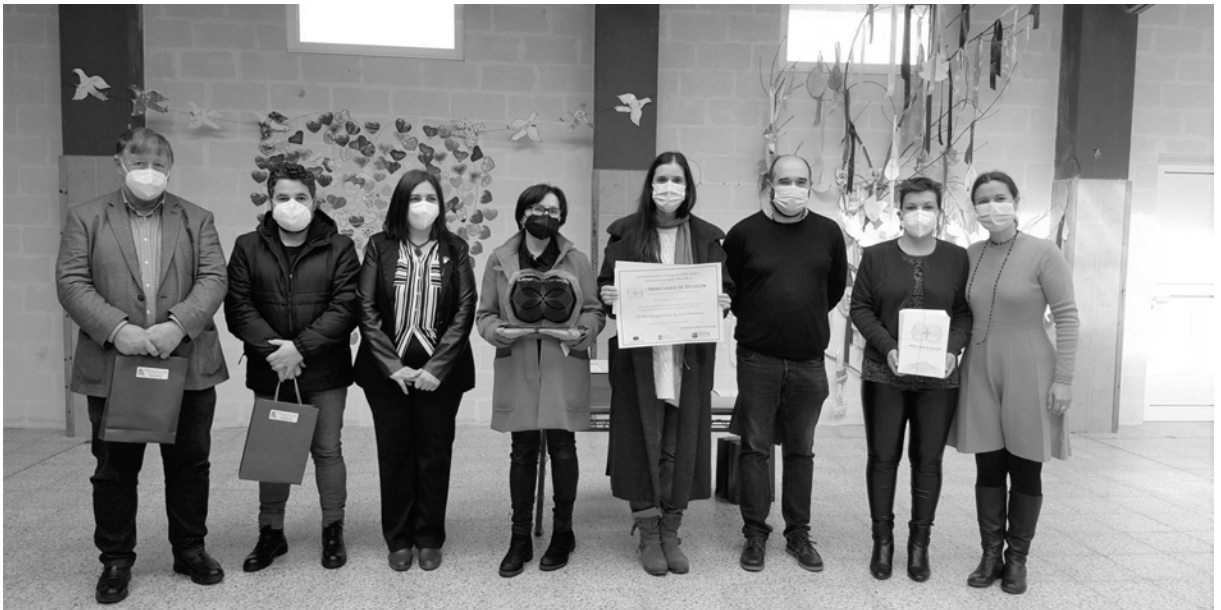
Entrega do premio no CPIP Virxe da Cela

Internacional (participando en actividades como “Símbolos de Paz” ou “Regala as túas palabras”).