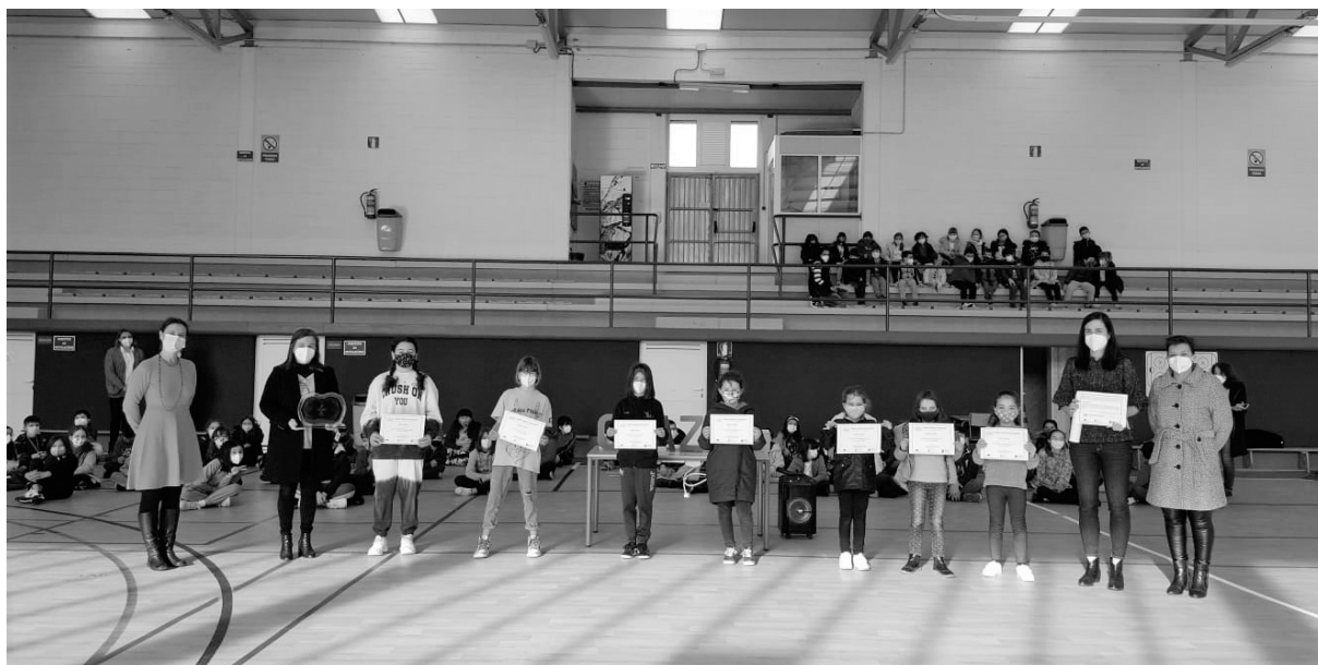
Entrega do premio no CEIP Ponte dos Brozos

ría B. ESO, Bacharelato, FP, Ensinanzas de Réxime Especial e Artísticas, resultando gañadoras as seguintes: