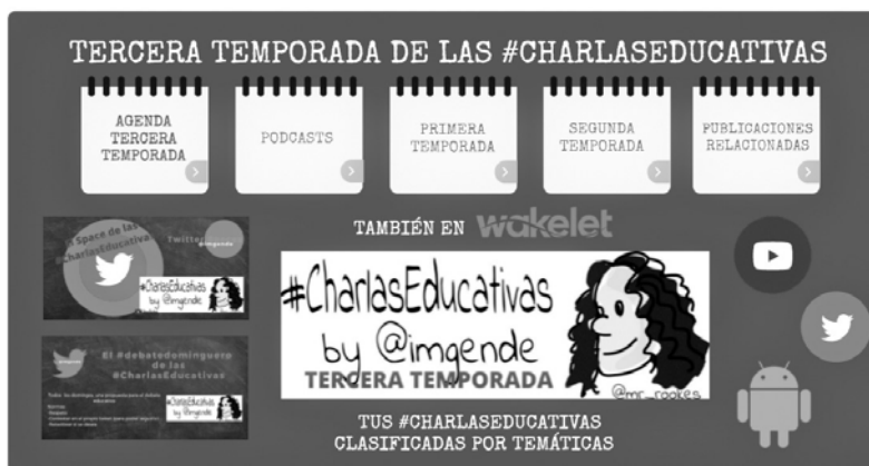
Terceira tempada das #CharlasEducativas

Engadido a iso, as charlas tiveron repercusión en publi-