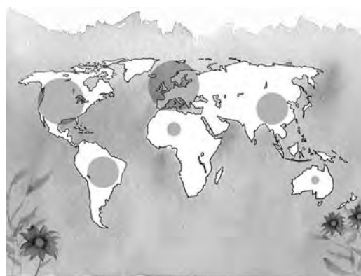
Figura 3. Mapa de incidencia da Covid-19 no mundo.