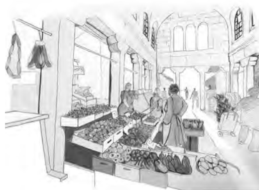
Figura 4. Mercado de abastos.

A crise sanitaria tamén deu unha oportunidade para pensar en cidades e modos de vida máis sustentables. Mateo decátase de que a cidade ten menos coches, menos ruído e o aire está máis limpo. Tamén toma conciencia de que os obxectos materiais non son o