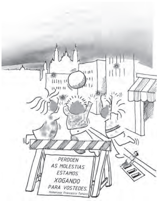
Figura 5. Homenaxe a F. Tonucci.

máis importante, e comeza a valorar máis a familia, as amizades e a veciñanza, que nos axudan a ser máis felices.