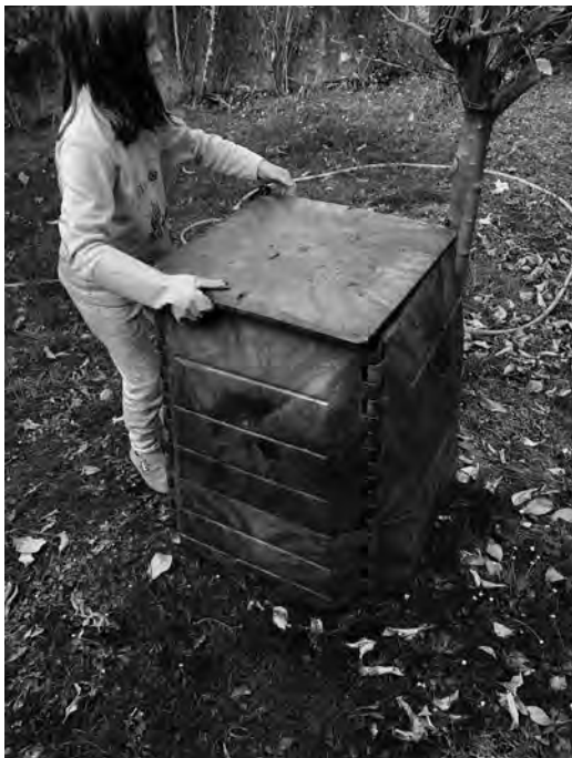
Unha boa oportunidade para a reciclaxe de alimentos e compostaxe.

Aquí van algunhas das tarefas que desenvolvemos: