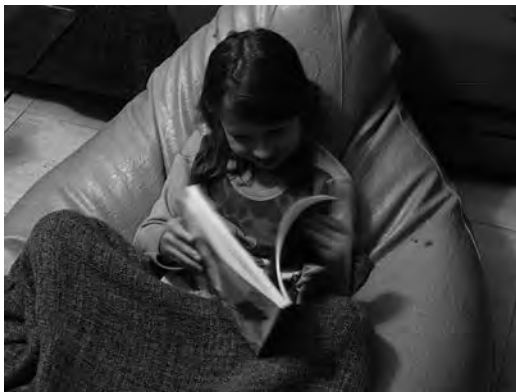
A lectura no acollemento da casa.