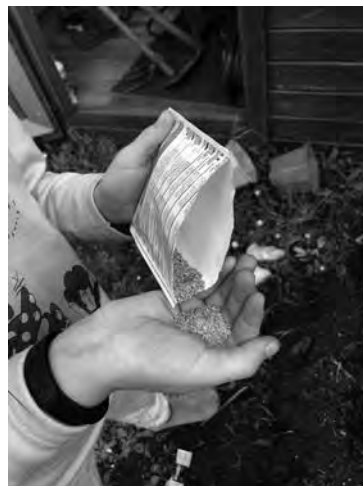
A semente, o xerme da vida.

Ao tempo, no sistema educativo percibíase certo desconcerto: a improvisación, a información contradictoria, as indicacións que non daban chegada dende os entes políticos e administrativos, as familias preocupadas e nalgúns casos “presionando” a escola. E, en moitos centros escolares o profesorado facendo “o que podía”, con enormes dificultades e falta de recursos e de competencias profesionais para atender unha situación nunca vivida, tan excepcional. Neste contexto xorde a primeira webinar dende o colexio, os primeiros contactos entre coles e familias, estudantes que se ven por cámara. Iníciase –en certa medida– un novo escenario de ensino-aprendizaxe.