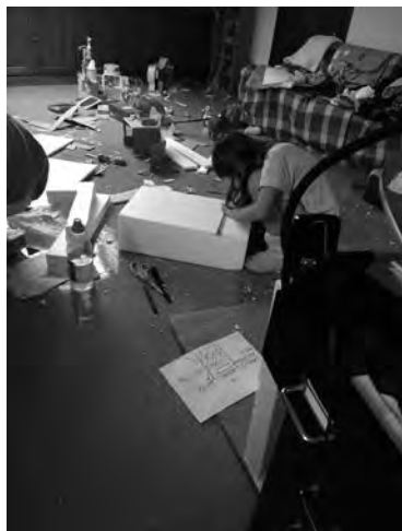
A arquitectura, deseño e construción.

casa na necesidade de saber, de indagar, de investigar e de debater dende diferentes puntos de vista sobre o que estaba acontecendo. Pero, como abordamos esta nova realidade de cunha nena de 9 anos...? Coincidiamos en que tiñamos que “vivir as circunstancias”. Polo tanto, a pandemia tiña que converterse, tamén, nunha oportunidade de aprendizaxe: os coñecementos das distintas áreas científicas integradas no sistema educativo eran fundamentais para apoiar educativamente esta vivencia. Tiñan que orientar as nosas indagacións, para intentar buscar respostas e novas cuestións.