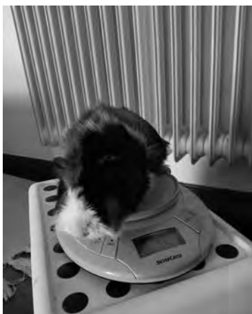
O coidado da alimentación e do corpo, básico mesmo para Nutela.

• As actividades domésticas. A lavadora, pasar o ferro, a preparación do xantar, supuxeron unha oportunidade para a asunción de responsabilidades no fogar. Dende sempre na nosa vivenda a distribución das tarefas rompe con estereotipos de xénero: todos e todas podemos facer de todo.