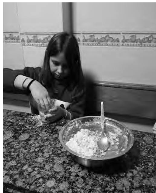
As proporcións e medidas no día a día.

– A lectura como instrumento de relaxación para os tempos de ocio.