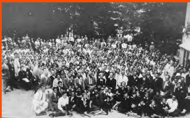
Participantes no Congreso de Locarno da Liga, 1927.

1921-2021: aos cen anos da creación da Liga Internacional da Escola Nova