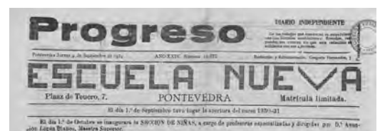
E desde Pontevedra, seguindo as propostas do Instituto-Escuela.

impulsor da asociación pedagóxica francesa “La Nouvelle Education”, antecedente do Groupe Français de l'Éducation Nouvelle (GFEN) [3] . Fermoza noticia que con outras serve para testemuñar dunha inquecandanza sentida entre unha parte do profesorado galego.