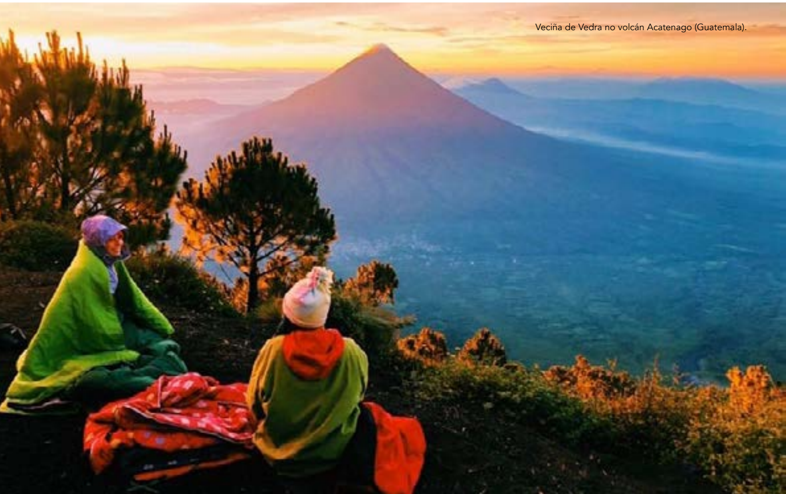
Veciña de Vedra no volcán Acatenago (Guatemala).

Trala presentación das actividades que acolle este proxecto, queda patente que o “Vedrea” tratou de xuntar unha serie de propostas socioeducativas e culturais en tempos de confinamento. A súa difusión realizouse a nivel municipal a través das redes sociais, do grupo de whatsapp e do boletín do concello.