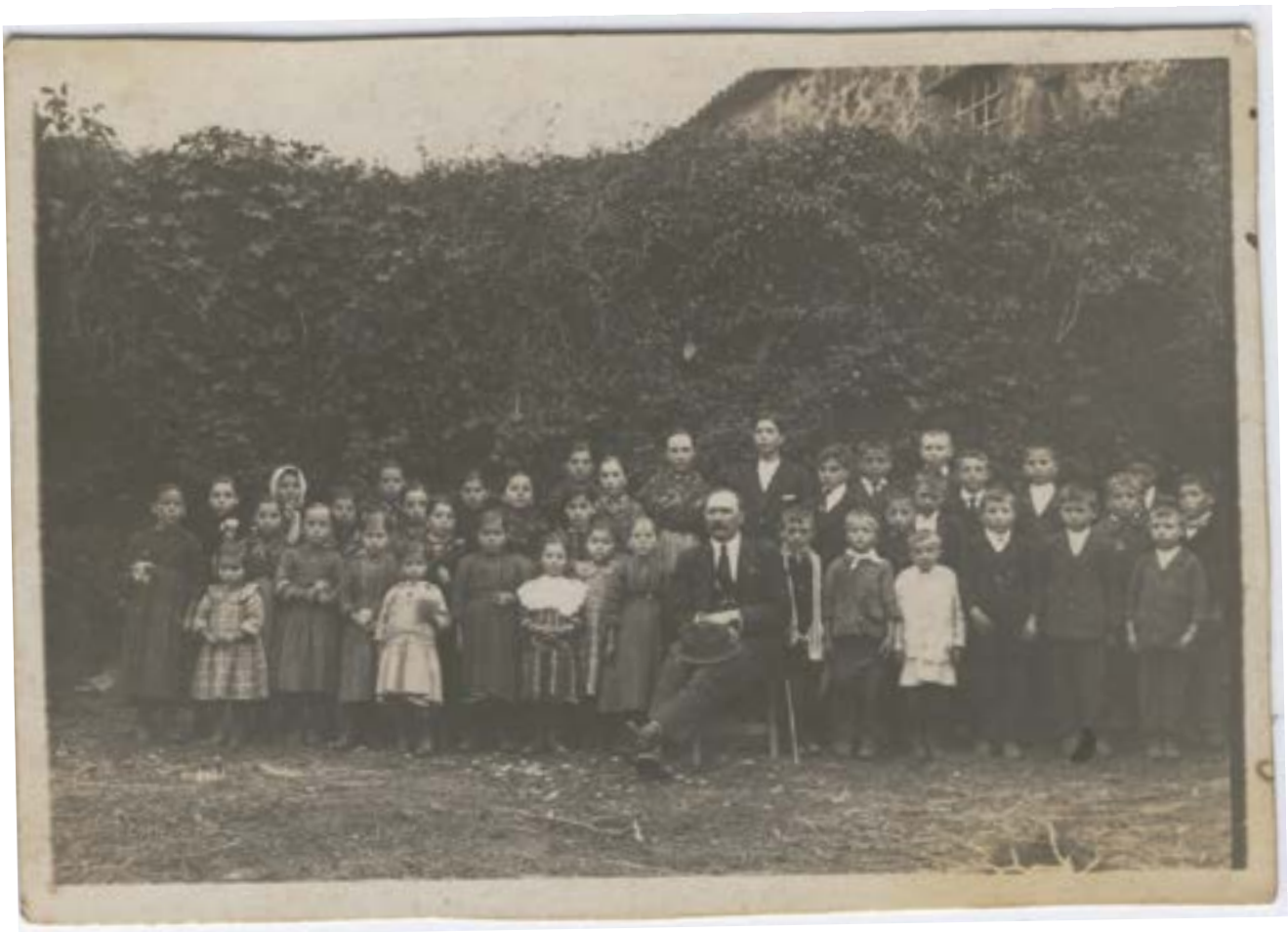
Alumnado da escola de San Xián de Sales.

Consideramos que era un bo momento para “recoñecerse no pasado” e para compartilo coas