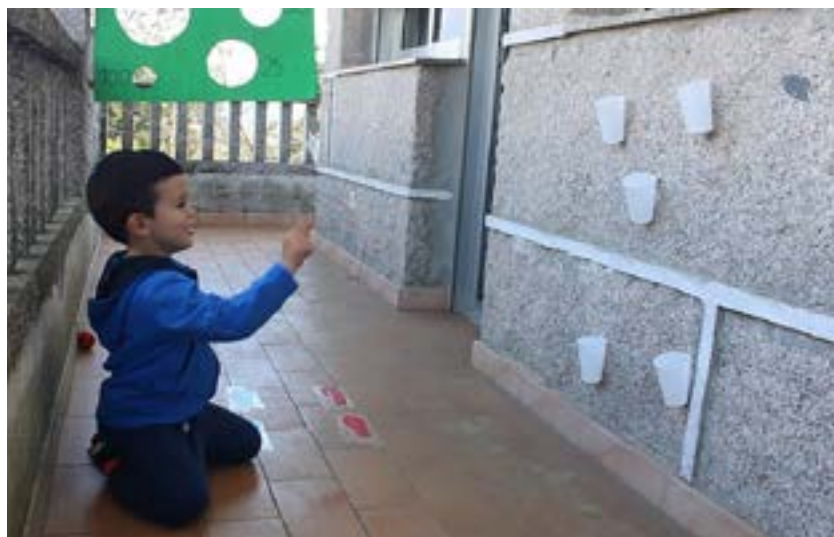
Táboa 1. Cronograma do proxecto

Na táboa 1, preséntanse un cronograma detallado dos fitos máis relevantes.