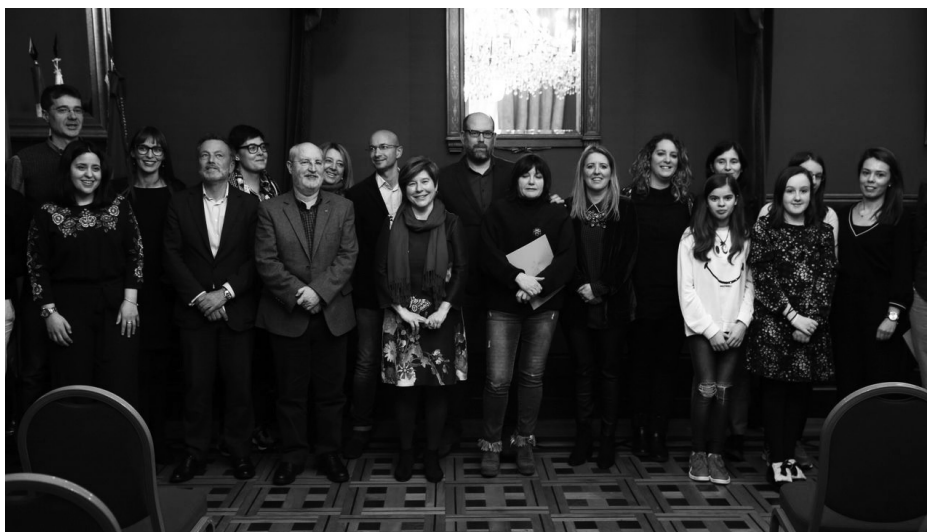
Entrega de premios dos Educacompostela.