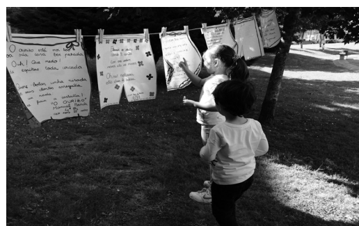
"Tendal dos poemas 17" no Milladoiro e en Bertamiráns, punto de parada de peregrinos e de paseantes.