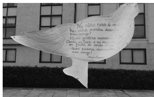
"Rechíos poéticos no tendal dos poemas 18". Unha escola de poemas galegos sobre paxaros expostos na rúa.

Pensémolo ben: de como nos proxectemos así nos verán. De nós depende. ■