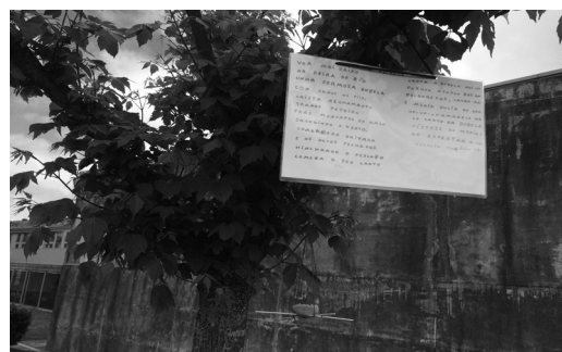
"Rechíos poéticos", poemas sobre a bubela escritos ex profeso por grandes da literatura infantil galega, pendurados das árbores xunto con comedeiros ecolóxicos para paxaros. Fonte InnovArte Educación Infantil.