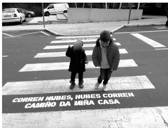
Plano do Milladoiro cos pasos de peóns marcados e os buscadores de versos rosalianos.

Resúltame moi difícil recoller nun espazo tan breve todo aquilo que se fai "de cara a fóra", fuxindo de tópicos escolares (fes-